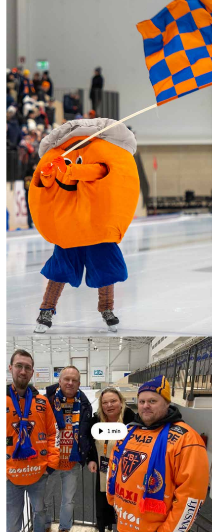
Bollnäs GIF:s ordförande och representanter för supporterklubben kan glädjas över bra publikiffror. Hör om förklaringen till framgångarna i klippet.

Bollnäs Bandy är en viktig del i många människors liv.