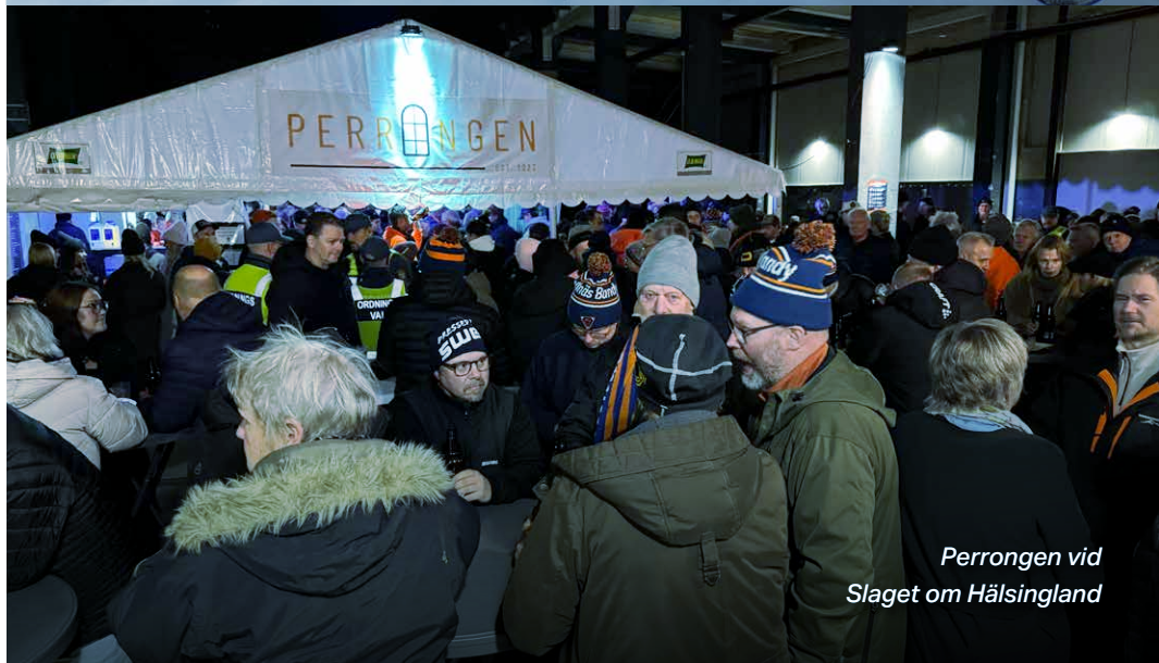
Perringen vid Slaget om Hälsingland