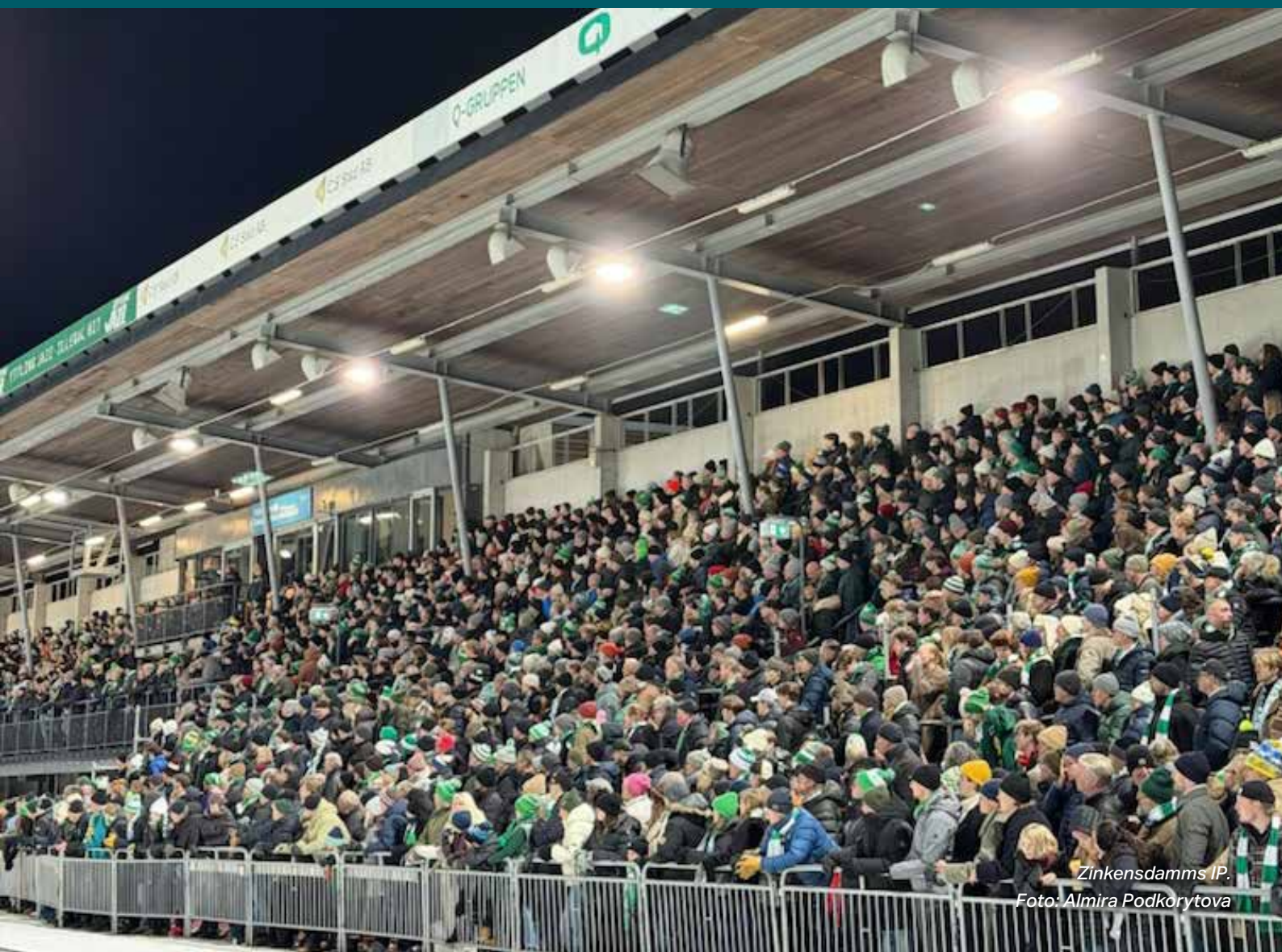
Zinkensdamms IP.